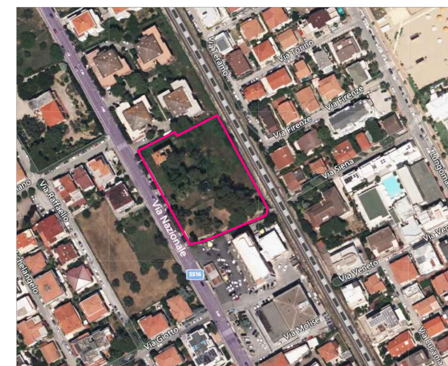
VEDUTA AEREA DELL'AREA DI PROGETTO

PLANIMETRIA D'INSIEME 1:200 INDICAZIONE ATTIVITA' LIMITROFE INDICAZIONE RETI ESTERNE