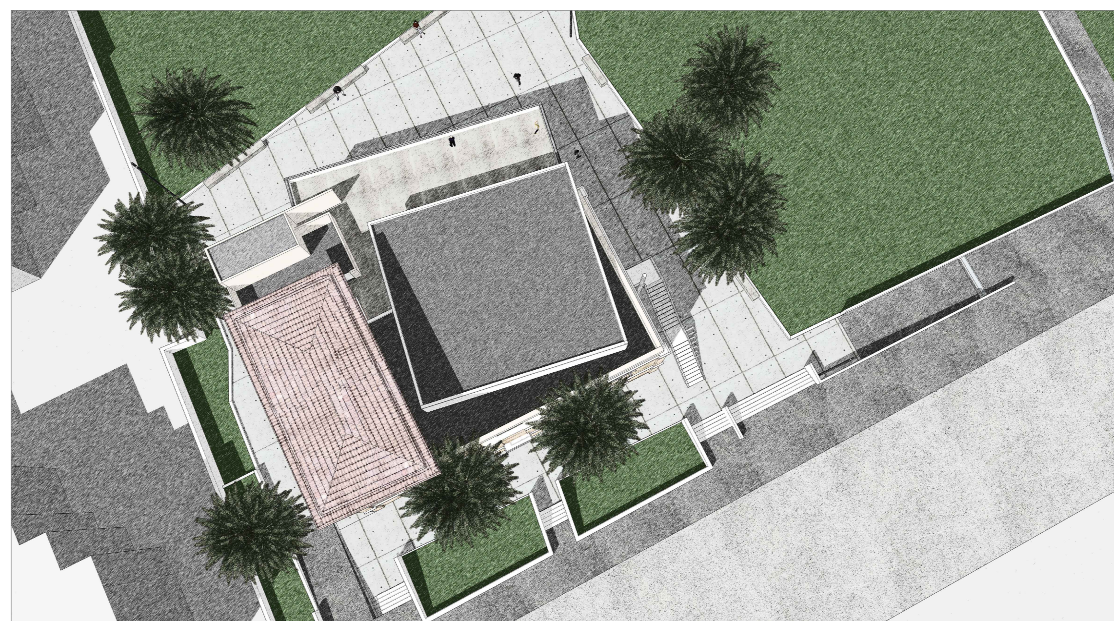
VISTA INDICATIVA 3D DA VIA NAZIONALE