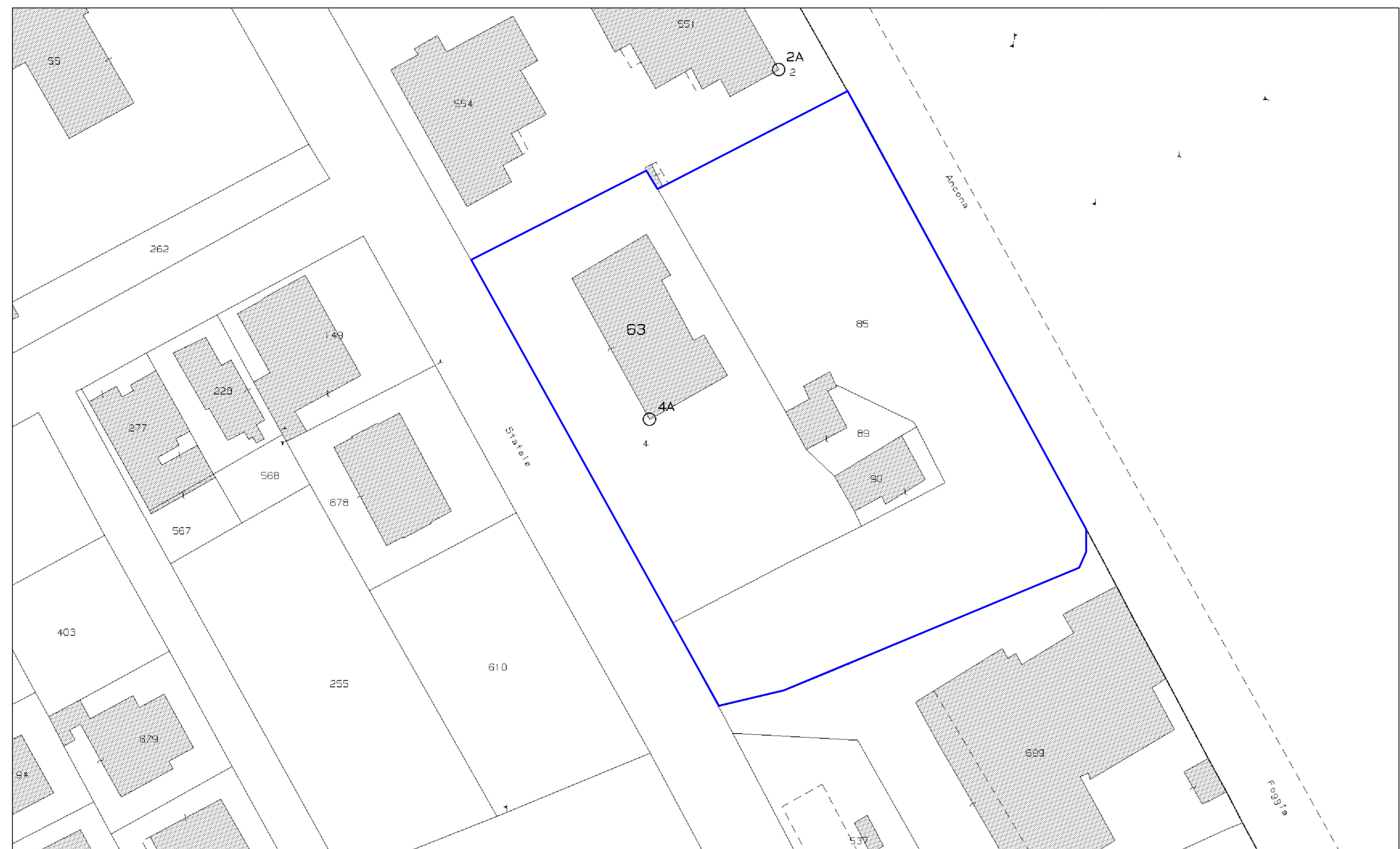
INQUADRAMENTO CATASTALE DELL'AREA DI PROGETTO 1:500 FG 31A P.LLE 63-90