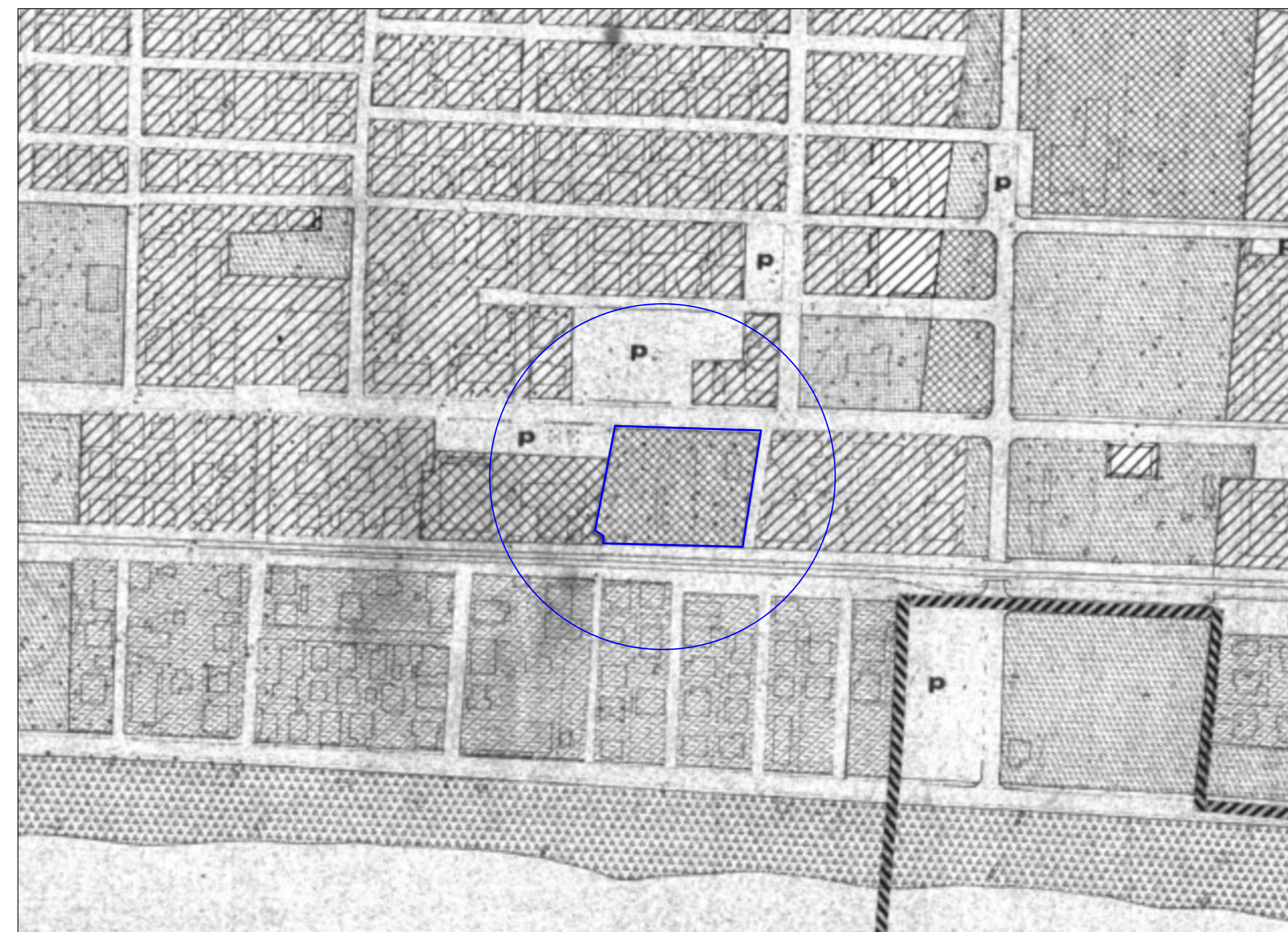
INQUADRAMENTO DELL'AREA DI PROGETTO RISPETTO ALLE PREVISIONI URBANISTICHE DEL P.R.G. 1:2000